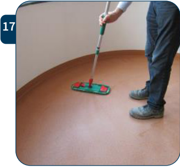
17 Droog de vloer goed na met een schone droge mop.