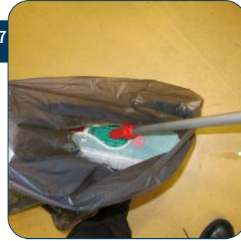
27 Indien een tweede laag nodig is, de mop in een plastic zak steken en dichthouden om het uitdrogen van de mop te voorkomen.