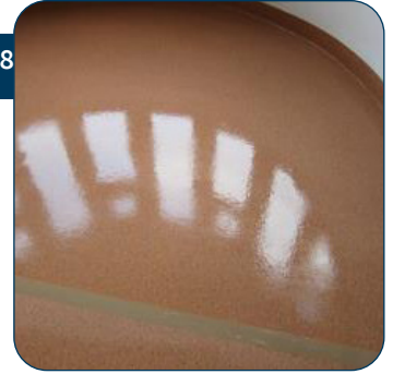
28 De vloer laten drogen. Geen ramen of deuren open zetten tijdens het drogen. Met een windturbine kan je de droogtijd inkorten.