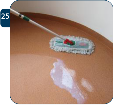
25 Giet polymeer in de verst verwijderde hoek op de vloer en verdeel de polymeer met de franjes van de mop open.