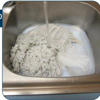
30 Na het werk de Super Flat Finish mop onder stromend water grondig uitspoelen zodat alle polymeer eruit is. De mop laten drogen.