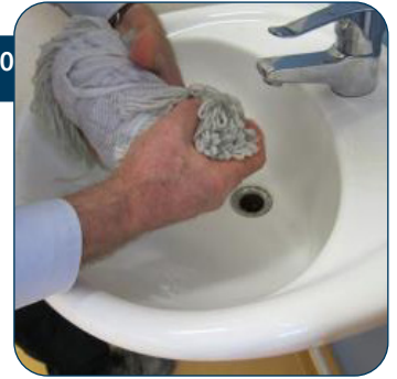
20 Rol de mop strak op om het water gelijkmatig te verdelen. De mop moet klamvochtig zijn, niet nat! Plaats de mop op het Uniko frame.