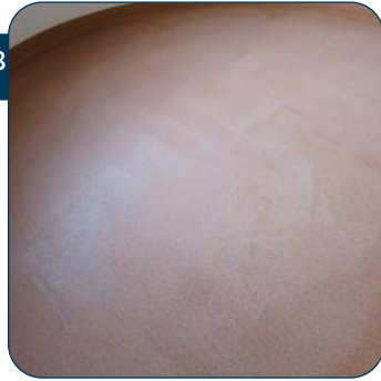
18 De vloer moet een egale kleur en een mat uitzicht hebben. Er mogen nergens nog glanzende plekken zijn!