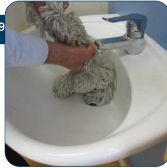
19 Maak de Super Flat Finish mop klamvochtig met water om de opname van polymeer te versnellen.