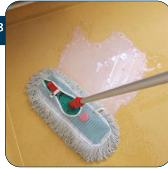
23 Drenk de klamvochtige Super Flat Finish mop in de polymeer zodat deze verzadigd is met het product.