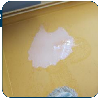
22 Giet een kleine plas polymeer op de vloer. Gebruik ongeveer 1 liter product per 50 tot 100 m 2 .