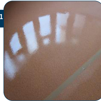
31 De vloer minimum 12 uur laten uitharden alvorens te betreden! Daarna met HIGH speed boenmachine en rode of witte pad opboenen.