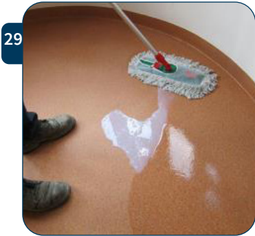
29 Indien toch een tweede laag polymeer nodig blijkt, herhaal dan stappen 21 tot 28.