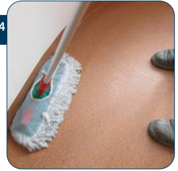
24 Vouw de franjes onder de mop om de zijkenen in te zetten met polymeer. Zo zal je weinig of geen polymeer op de plinten wrijven.