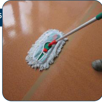
26 Polymeer gelijkmatig over de vloer uitwrijven met de mop in overlappende "Z-bewegingen" naar de uitgang toe.