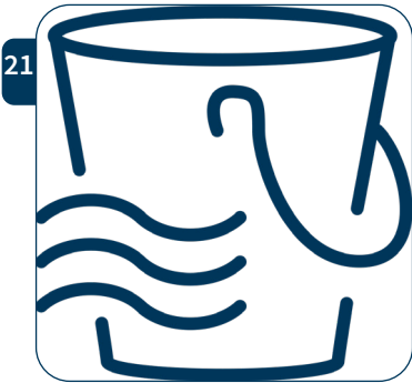
21 Giet Floor Coat Silk (voor glanzende afwerking) OF Floor Coat Matt (voor matte afwerking) in de maatbeker.