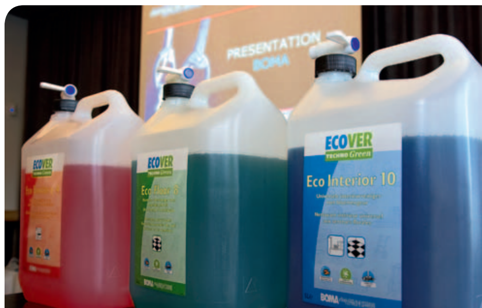
Ecover: duurzaam vanaf de oorsprong van grondstoffen tot en met de afbraak van eindproducten.

Tenslotte gaan Bresseleers en Tops in op het thema van de dag. Hoe kunnen schoonmaakbedrijven ecologisch schoonmaken ‘verkopend’ aan hun klanten. Belangrijk